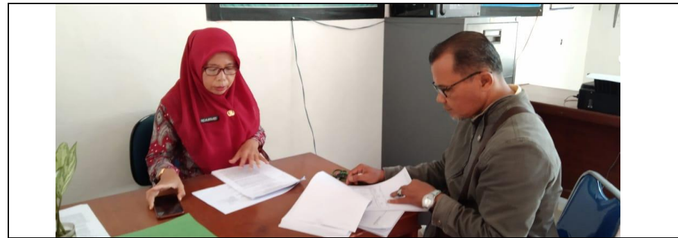
Pembahasan Dokumen APBNagari Tahun Anggaran 2022 antara Nagari Lakitan Utara dengan Tim Evaluasi Tk. Kecamatan