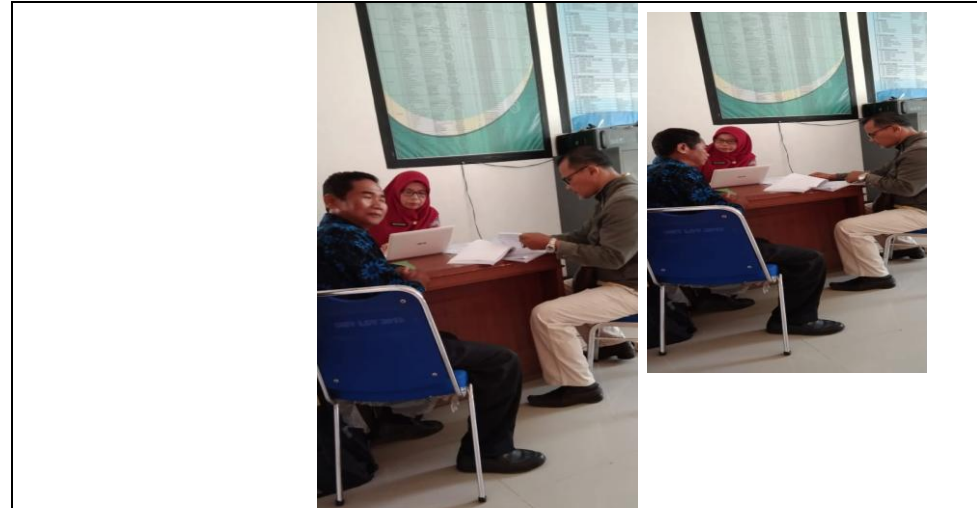
Pembahasan Dokumen APBNagari Tahun Anggaran 2022 antara Nagari Lakitan Utara dengan Tim Evaluasi Tk. Kecamatan